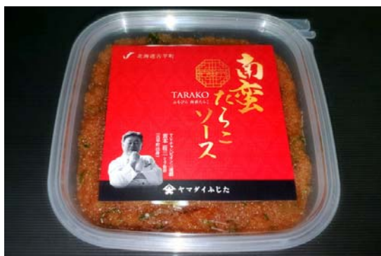
《南蛮たらこソース》