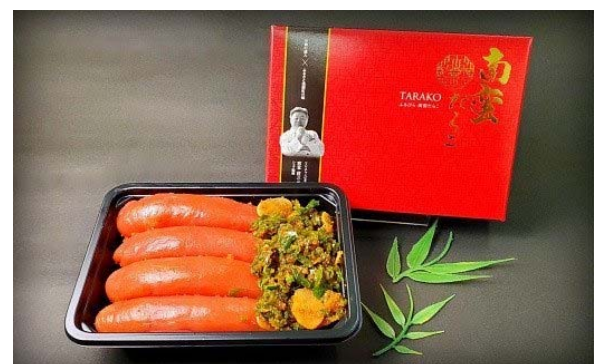
ソース開発の過程で生まれた 《南蛮たらこ》