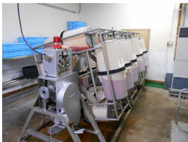
《たらこの漬け込み工程》