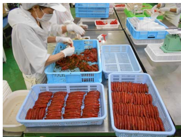
《たらこと具材の調合》