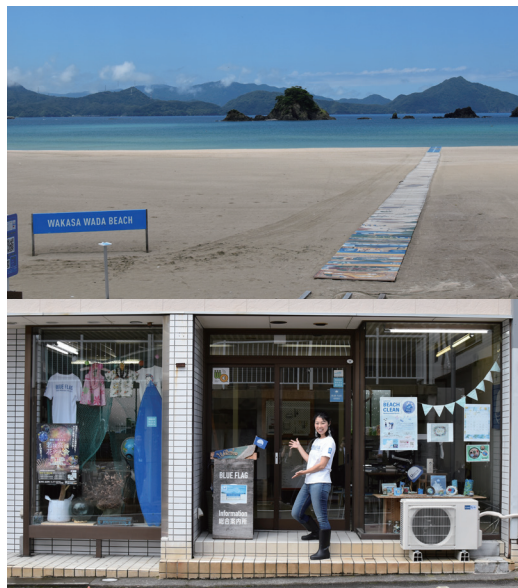
(上) 若狭和田ビーチ。(下) ビーチのすぐそばにある活動拠点「ブルーフラッグアカデミー+」と永野由佳さん。

1年限定で始めた「Blue Cafe」は、高浜町へのUターン者への引き継ぎが決まり、事業実施期間が終了した翌年には同じ場所でイタリアンレストランがオープン。隣接するスペースでは、ワークショップをはじめとした環境教育活動も継続的に行われている。