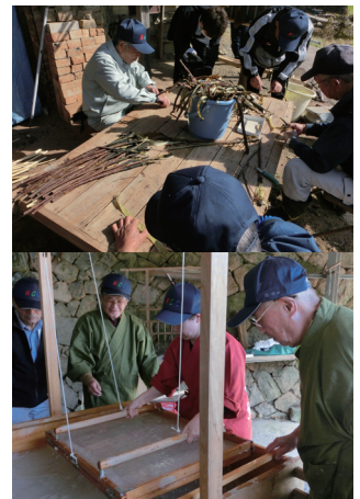
（上）楮 こうぞ の皮を剥き、原料となる繊維を取り出す。原料の楮100kgから得られる紙の原料はわずか5kgほど。

観光スポットとして「レトロな町並み」が認知されていることから、インバウンド客をターゲットとした取り組みを強化していくこととなった。