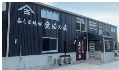
(左) 品質をチェックする坂元さん。 (右) 無垢の蔵の外観。